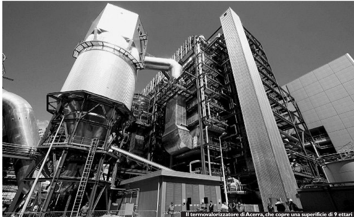
Il termovalorizzatore di Acerra, che copre una superficie di 9 ettari

biando la storia - ha dichiarato ancora Berlusconi -. Lo stiamo facendo perché lo Stato c'è e continuerà ad esserci per risolvere questa situazione in Campania. Se ci fosse un'idea le striscione non ci sarebbe scritto sopra "arrivo", perché non siamo arrivati qui a risolvere tutte le situazioni della vecchia emergenza. Ci dovrebbe essere scritto sopra "partenza", perché è da qui che si parte per risolvere definitivamente il problema dello smaltimento dei rifiuti in Campania, ma da qui si parte anche come esempio, come paradigma per risolvere il problema di smaltimento di rifiuti in tante regioni d'Italia dove si è ancora prossimi alla ripetizione di una situazione come quella della Campania». L'impianto di Acerra brucerà, dall'estate quando cioè andrà a pieno regime, 600mila tonnellate di rifiuti all'anno e garantirà risparmio energetico ed energia pulita. Il Comune incasserà 3 milioni e 200mila euro come compensazione per la presenza del termovalorizzatore sul proprio territorio. Con il termovalorizzatore verrà garantito «risparmio economico e ambientale», ha spiegato Bertolaso, che ha poi sottolineato: «Sui rifiuti la Campania era la Cenerentola, oggi è la terza regione italiana».