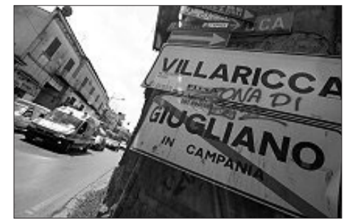
NAPOLI (PERIFERIA NORD) Un inceneritore per scarti speciali

Il sito del Casertano è uno dei primi individuati, da almeno dieci anni, per la costruzione di un termovalorizzatore. L'area rientra anche nella legge dello scorso anno per la soluzione dell'emergenza rifiuti in Campania. Zona requisita, ma non c'è ancora la gara per l'assegnazione dei lavori e per il momento il territorio ospita una discarica e un sito di trasferta. (V.Ch.)