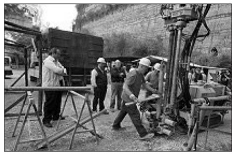
NAPOLI (PERIFERIA EST) Per ora è stata indicata l'area

Uno dei nuovi termovalorizzatori previsti in Campania dovrebbe sorgere a Napoli, precisamente nell'area dell'ex depuratore Arpac in via De Roberto, periferia orientale della città. Una scelta giunta dopo che era stata scartata l'ipotesi Agnano, zona sismica, nella parte opposta. All'indicazione dell'area non sono però ancora seguite le pratiche di indizione della gara per la bonifica e la costruzione dell'impianto. (V.Ch.)