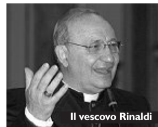
Il vescovo Rinaldi

È la realtà, lo ha detto lei stesso. Noi non ci rassegniamo alla routine del quotidiano incenerimento. Non ci daremo pace. Se questa ingombrante presenza fa male non è umana né cristiana. Che futuro chiedete? Acerra ha visto fallire per intrighi politici l'insediamento dell'Università e del Policlinico e del Polo pediatrico mediterraneo. Si continui a pensare in grande. Abbiamo acquisito competenze in materia di ambiente. Chiediamo che ci siano riconosciute. Dategli una piccola Università ambientale per continuare il dibattito e il confronto democratico.